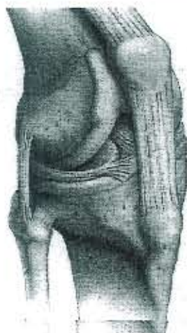
正常健康膝盖，上边的胫骨与下边的腓骨完美，中间还有一道软骨。