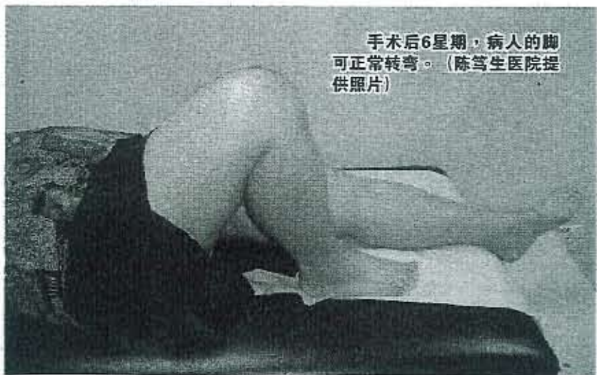
手术后6星期，病人的脚可正常转弯。

更换膝盖后的显著效果，包括疼痛不复存在、畸形的骨头恢复正常、关节可转120度，其中约95%的人在10至15年内不再受到膝盖关节炎的困扰。