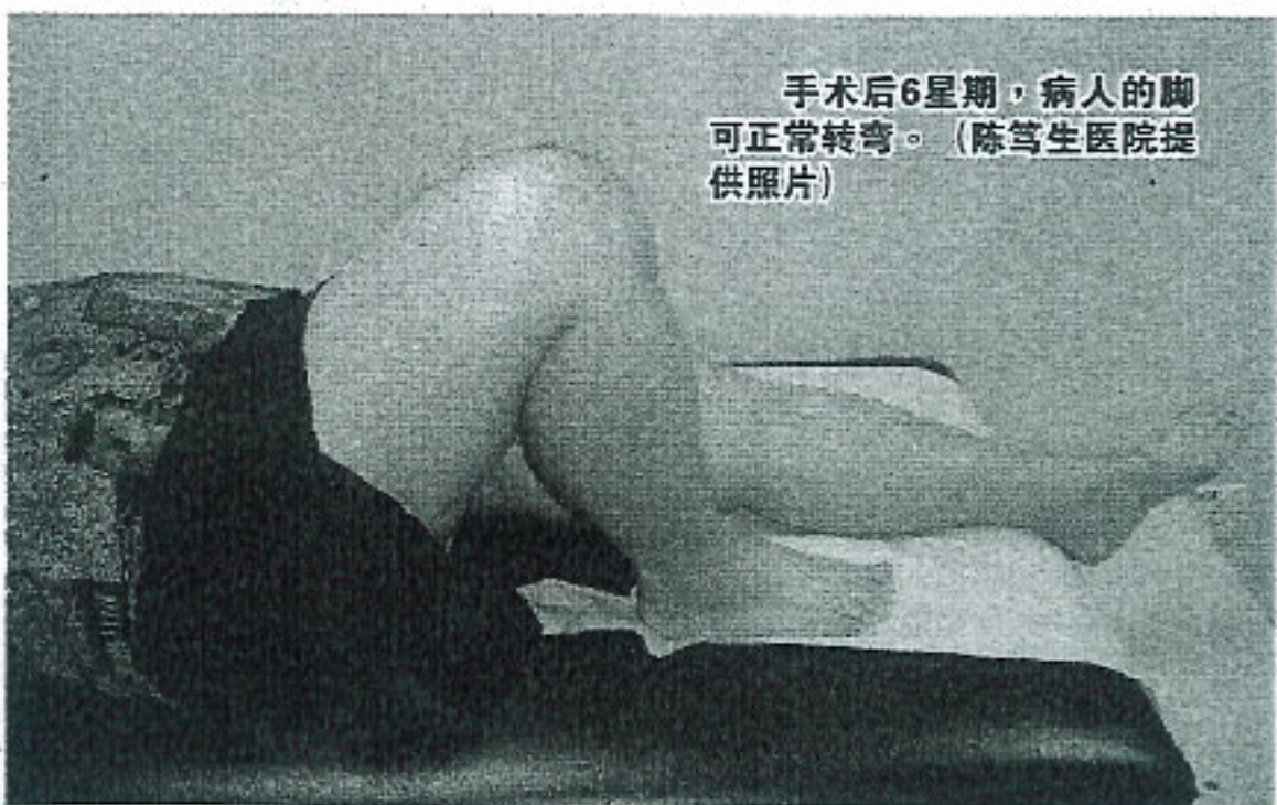
手术后6星期，病人的脚可正常转弯。

更换膝盖后的显著效果，包括疼痛不复存在、畸形的骨头恢复正常、关节可转120度，其中约95%的人在10至15年内不再受到膝盖关节炎的困扰。