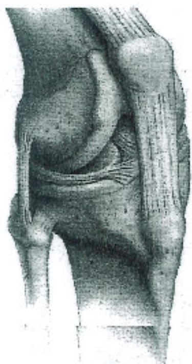
正常健康膝盖，上边的胫骨与下边的腓骨完美，中间还有一道软骨。